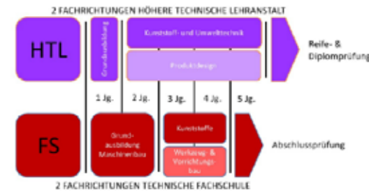
Ausbildungsschwerpunkte an der Andorf Technology School im Überblick