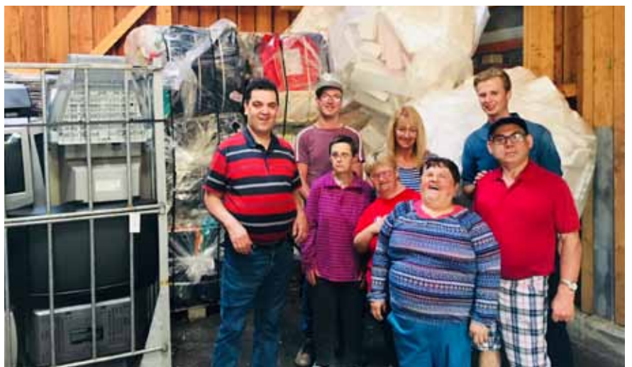
Die Werkstätte Eggerding erfuhr beim Besuch im Altstoffsammelzentrum mehr über Mülltrennung