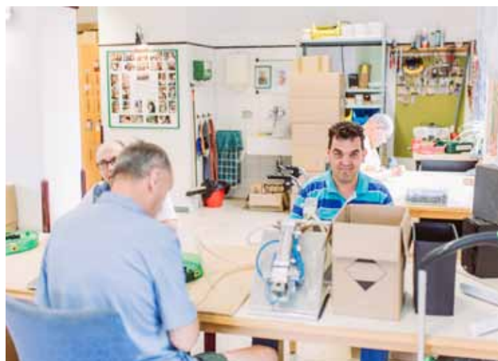
Beim Tag der offenen Tür wurde der Arbeitsplatz der Lebenshilfe-Klienten vorgestellt