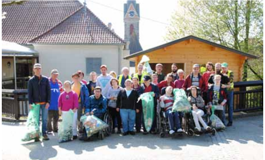
Bei einer Flurreinigungsaktion säuberte die Werkstätte Eggerding die Spazierwege in der Gemeinde

Höhepunkte des Projektes bildeten die Flurreinigungsaktion, bei der die Spazierwege der Gemeinde von Müll gesäubert wurden. Der Bezirksabfallverband Schärding organisierte einen Besuch im Altstoffsammelzentrum und Klärwerk Andorf und vertiefte das Wissen mit einem Vortrag zum Thema ‚richtig Müll trennen‘.